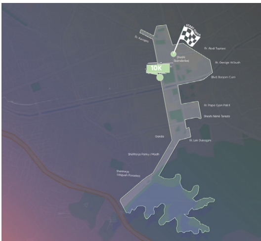
Tirana 10K (10 km)