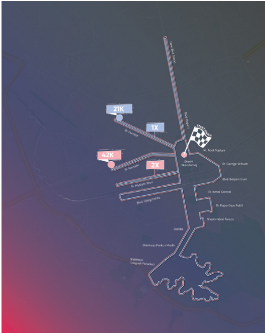
Marathon (42.195 km) Half Marathon (21,0975 km)